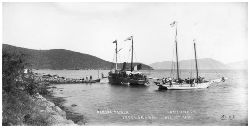
Bahía de Topolobampo. Referencia: (Navidad, 2006, pág. 201)

Topolobampo tiene su origen y su nombre Cahita o Mayo; ya que fueron los Mayos del Río Zuaque (Fuerte), quienes descubrieron este apacible lugar, de gran riqueza natural en tiempos prehispánicos. A Topolobampo llegaron los Cahitas, atraídos tal vez por la caza, la pesca, la recolección de almejas o caracoles o quizá por mera curiosidad o en un afán por conocer la región; pero no cabe duda de que fueron esos grupos indígenas quienes bautizaron a Topolobampo con ese nombre.